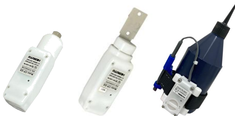
左から「はめこみユニット」「ひっぱりユニット」「ネジロック剤アタッチメント」

ヘルツ電子株式会社は、高い品質が求められる組立工程・検査工程などの生産工程における作業者のミスの防止（ポカヨケ）を支援するIoTツール群である「ポカヨケツール」の新商品として、 はめこみユニット「PU-SX」、ひっぱりユニット「PC-SX」、ネジロック剤アタッチメント「TFC-100-01-850」 の3商品を順次発売いたします。